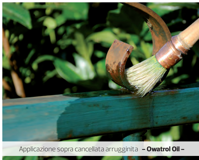
Applicazione sopra cancellata arrugginita – Owatrol Oil –